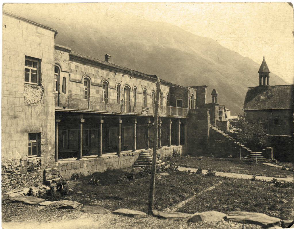
ალექსანდრე ყაზბეგის სახლი და ყაზბეგების კარის ეკლესია სტეფანწმინდაში