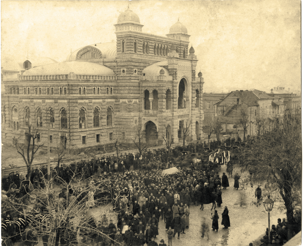
ალექსანდრე ყაზბეგის გადასვენება სტეფანწმინდაში, პროცესია ოპერის თეატრთან, თბილისი, 19 დეკემბერი, 1893 წ.