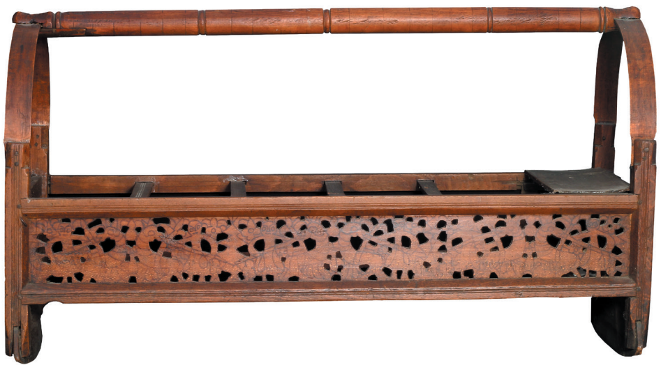
ალექსანდრე ყაზბეგის აკვანი, XIX ს. ხე, 63X112 სმ.