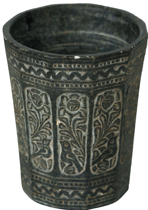
ალექსანდრე ყაზბეგის ჭიქა