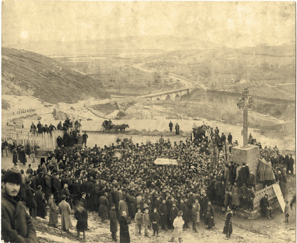
ალექსანდრე ყაზბეგის გადასვენება სტეფანწმინდაში, პროცესია ვერის ჯვართან, თბილისი, 19 დეკემბერი, 1893 წ.